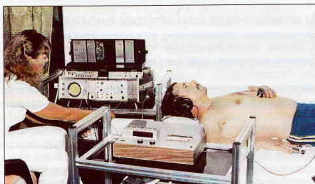
6. ábra. A biofeedback technika segítségével befolyásolni lehet az emocionális feszültség szintjét

Ez az eset az űrrepülés megoldatlan pszichológiai problémáira hívta fel a figyelmet. Újra és újra felmerült a kérdés, hogy milyen hatásai vannak az űrrepülés stressz tényezőinek az űrhajósok szellemi munkavégző képességére, hogyan lehet lemérni az emocionális feszültség szintjét, hogyan alakult ki a hajózók rezerv nélküli állapota? Biofeedback technika segítségével befolyásolni lehet-e az emocionális feszültség szintjét, illetve az információ-feldolgozó képesség, az emocionális feszültségszint és a rezerv nélküli állapot mérésével távol lehet-e tartani a repüléstől az alkalmatlan jelölteket?