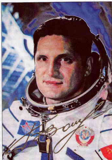
4. ábra. B. Volinov a Szaljut-5 parancsnoka

B. Volinov űrhajóparancsnok kénytelen volt egyedül, a fedélzeti mérnök segítségével nélkülözni a leszálláshoz. A földet érés nem sikerült. Az ejtőernyőn lóbálkozó űrhajó éppen a legnagyobb kilengésében volt, amikor a puha leszállást biztosító földközeli fékező rakéták működésbe léptek, ezért azok az űrhajót nem fékezték le, hanem odébb