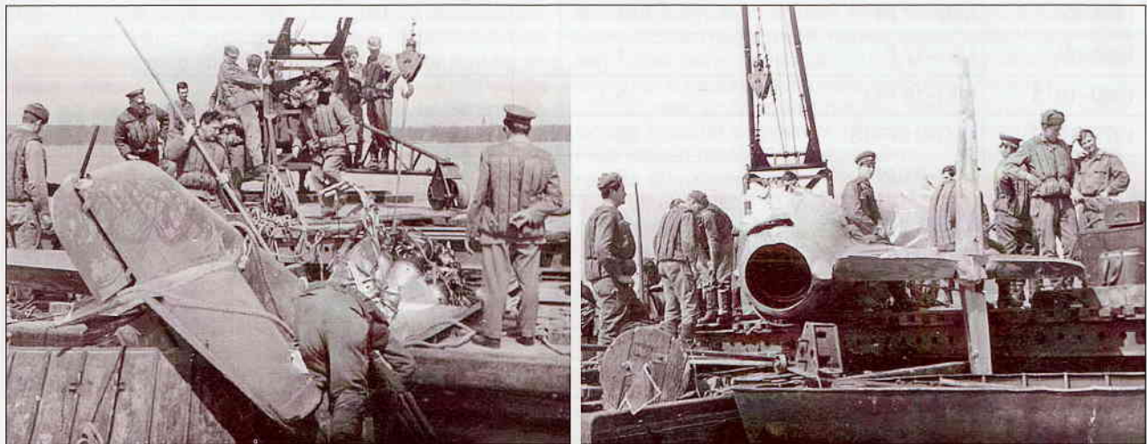
1. ábra. A Tisza árterére, az előtött szolnoki Szandai rétre zuhant MiG-15-ös

ÖSSZEFOGLALÁS: A magyar űrkatatók által kifejlesztett, a szellemi munkavégző képesség mérésére szolgáló módszer és műszer sikerrel működött a Szaljut-6 és Szaljut-7 fedélzetén. Segítségével a magyar kutatóknak a világon először sikerült lemérni az űrállomások fedélzetén, hogy az űrhajósok információ-feldolgozó képessége a súlytalanságban csökken.