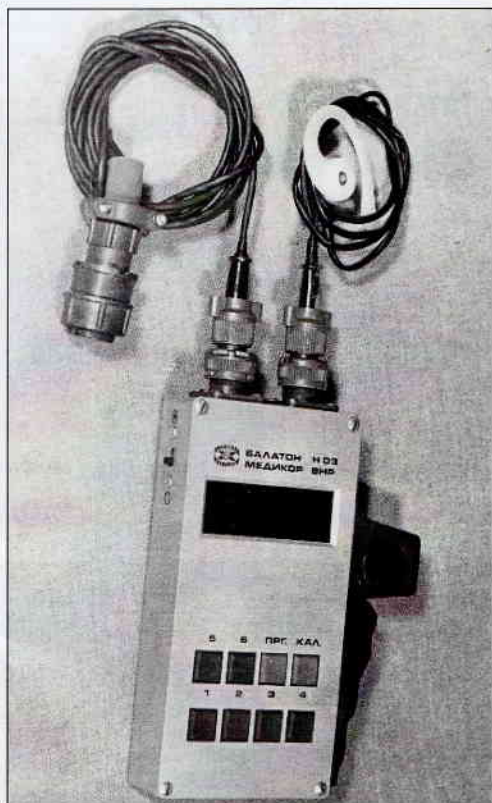
7. ábra. Az eredeti Balaton készülék a robusztus fedélzeti csatlakozókkal