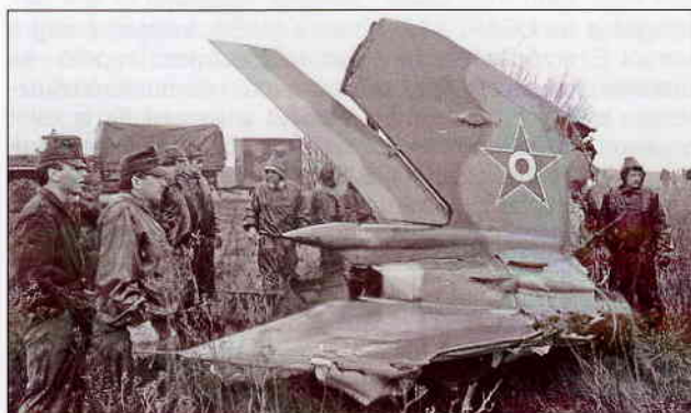
2. ábra. Az 1989. március 14-én lezuhant MiG-21-es

A kedvezőtlen baleseti statisztika miatt joggal merült fel a kérdés, hogy miért ilyen gyakoriak a katasztrófák? A gépek irányítása meghaladja-e a hajózók információ feldolgozó képességeinek határait?