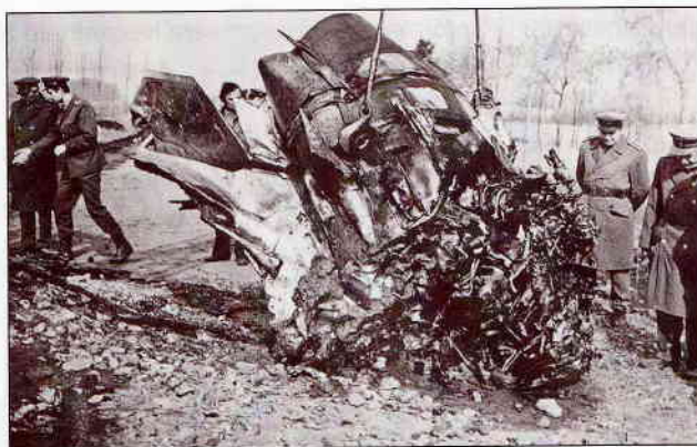
3. ábra. 1975. május 15-én egy MiG-21F-13 típusú gép katasztrófája

leálltak a fedélzeti rendszerek is, és az űrhajósok életveszélybe kerültek.